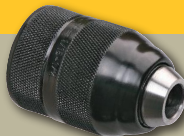
REF. 124K Mandrin sans clé, spécial meuleuse

D = 42,5mm A = 6,5 mm L = 64 mm L1 = 75 mm