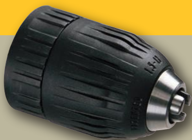
REF. 121K Mandrin sans clé à serrage manuel